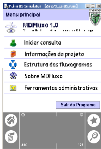
(b) Menu principal