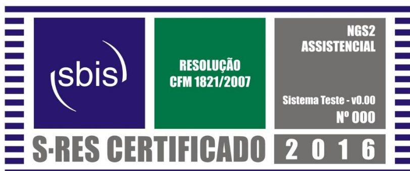
Figura 1: Modelo ilustrativo do Selo de Certificação SBIS

Apenas os S-RES que tenham sido certificados pela SBIS terão o direito, não exclusivo, de utilizar o selo SBIS em seus respectivos manuais e materiais promocionais durante o período de vigência do respectivo certificado (ver item 4.4. ).